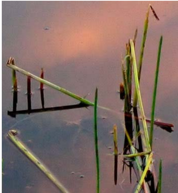
تصویر پس از حذف نویز با NeatImage