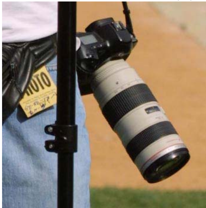
تصویر قبل از شارپ شدن

این ابزار عالی میتواند انواع مختلف Sharp سازی مانند شارپ سازی بدون هاله های رنگی، شارپ سازی لبه ها ، Lab Sharpening و... را انجام دهد. امکان کنترل میزان عملکرد و نیز عدم افزایش نویز از دیگر خصوصیات آن است. همچنین برای تصاویر با ISO بالا یا پایین کنترلهای خاصی در نظر گرفته است.