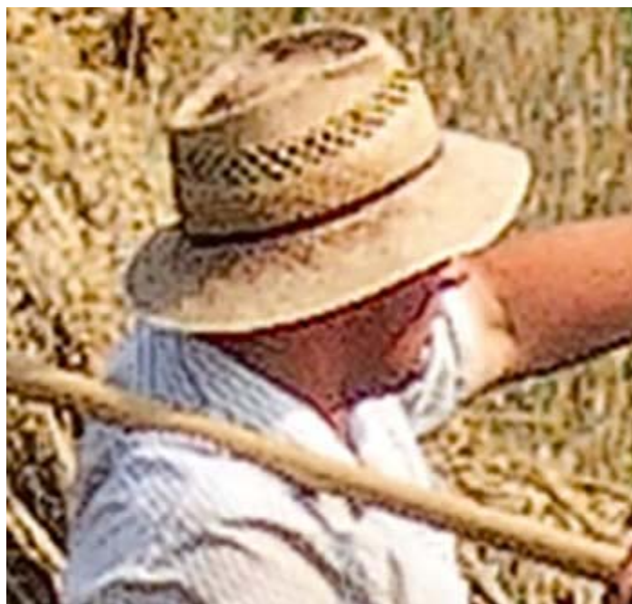
تصویر بزرگ شده با استفاده از فتوشاپ

عكس فوق در اصل يك تصوير ۴۰ مگابایتی بوده است كه توسط يك Back ۱۶ مگاپيكسلی كداك و لنز Zeiss Sonar ۴mm f/۲.۸ با دیافراگم ۸، سرعت شاتر بالا و ۳ پایه سنگین گرفته شده است. (این تفاسیر برای آن است که در کیفیت اصل تصویر شکی نداشته باشید!) حال يك قسمت كوچك از آن را انتخاب کرده و آنرا با دو روش (استفاده از Bicubic Interpolation فتوشاپ و استفاده از SmartScale) بسیار بزرگ می نمایم.