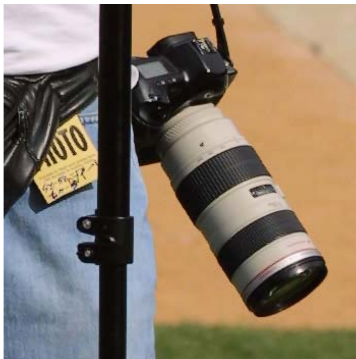
تصویر شارپ شده با Intellisharpen