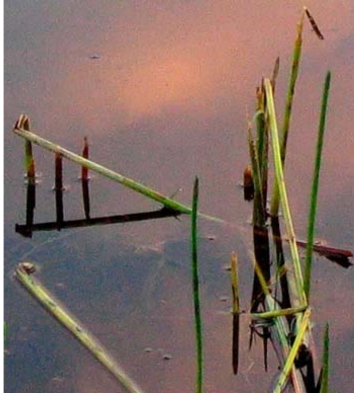
تصویر قبل از حذف نویز