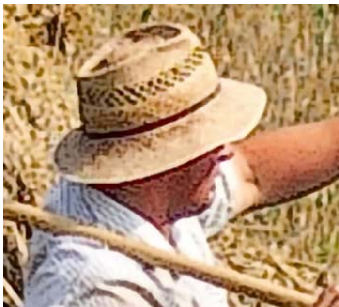
تصویر بزرگ شده با استفاده از SmartScale

شاید در نظر اول این ۲ تصویر تفاوتی نداشته باشند. اما با دقت بیشتر تفاوت‌هایی دیده میشوند که بخصوص در چاپهای بزرگ خود را نشان خواهند داد. به عنوان نمونه اگر به لبه کلاه (در مرز کلاه و صورت) دقت کنید، متوجه می‌شوید که ناصافی لبه در تصویر مربوط به SmartScale کمتر است و تصویر دقیقتر میباشد.